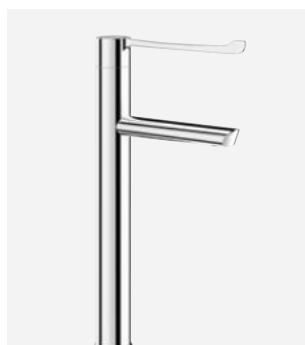
Nieruchoma wylewka H.300 L.160 Nr DELABIE: 2665T3