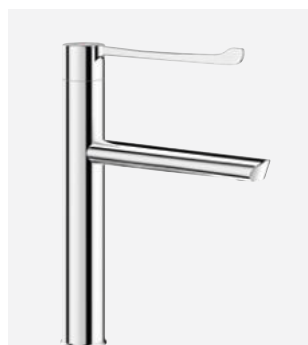
Nieruchoma wylewka H.200 L.200 Nr DELABIE: 2665T5