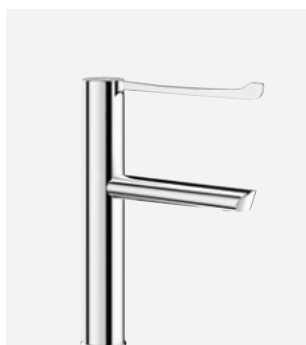
Nieruchoma wylewka H.160 L.160 Nr DELABIE: 2665T1