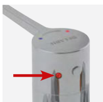
Ułatwiona dezynfekcja termiczna nie wymaga demontażu uchwyty