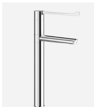
Ruchoma wylewka H.300 L.160 Nr DELABIE: 2664T3