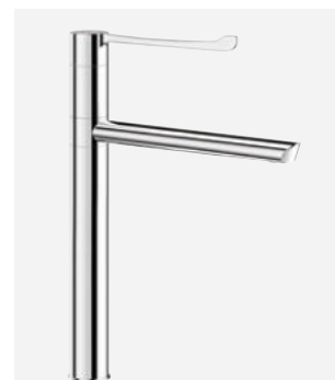
Ruchoma wylewka H.300 L.250 Nr DELABIE: 2664T4