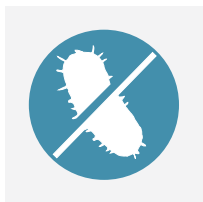
Całkowita higiena: kontrola biofilmu