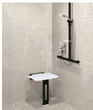
Przykład instalacji, Składane siedzisko natryskowe Be-Line® z podporą w matowej czerni Nr DELABIE: 511930BK

Ten międzynarodowy konkurs stanowi wyjątkową platformę łączącą projektantów produktów i architektów.