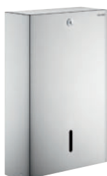
Ścienne podajniki ręczników papierowych ZZ - 750 sztuk Nr 6601