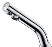
Elektryczny zawór umywalkowy BINOPTIC Nr 378015